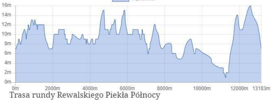
Trasa rundy Rewalskiego Piekla Północy